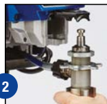
2 Открыть дверцу и извлечь насос