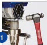
1 Ослабить зажимную гайку

Экономия времени и отсутствие необходимости оплаты работ по замене насоса.