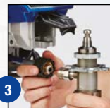
3 Открыть шланг и всасывающий патрубок